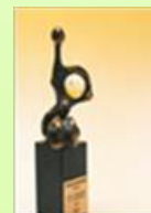
Prinses Margriet prijs 1992

In 1997 werd het eerste symposium PDL georganiseerd. Nu precies 20 jaar later organiseren we ons 25-jarig jubileumcongres en wel op: 7 november a.s. Zet deze datum al vast in je agenda!