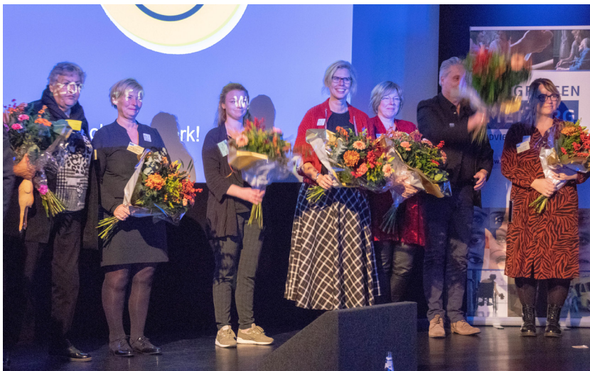
Foto: PDL Bestuur in 2019,

De PDL-methode is volop in ontwikkeling en maakt gebruik van de nieuwste technieken. Onze wens voor de toekomst is dat de wetenschap daarbij aangehaakt blijft. Om die reden zijn vrijwilligers die actief deelnemen aan kennisnetwerken een pré. Voor deze functie geldt een vrijwilligersvergoeding. Reacties graag per mail naar info@stichtingpdl.nl . We kijken ernaar uit om kennis te maken!